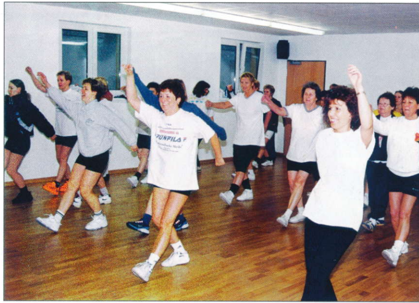
Gymnastik im neuen Vereinsheim

Der Zuspruch gestaltet sich entsprechend, möglicherweise ist der Gymnastikraum im neuen Vereinsheim doch zu klein und man braucht demnächst zusätzliche Zeiten.