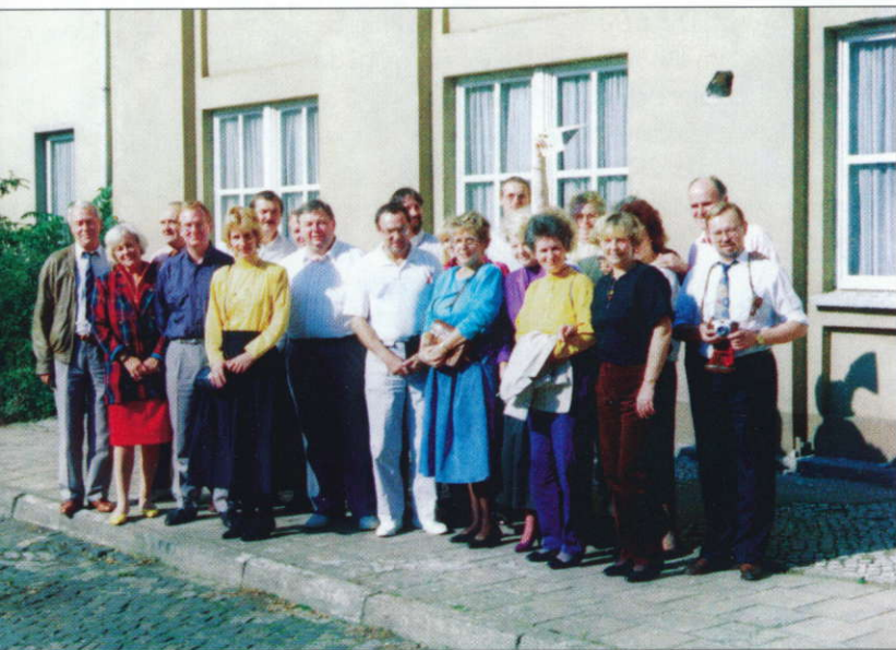
Die Vorstände vom ESV Lok Potsdam und TSV Uesen 1990 in Potsdam

standen die Beziehungen zu den Sportlern im Ausbesserungswerk Oppeln. Es ist schon erstaunlich, wie niedrig die Fremdsprachbarriere sein kann, wenn man einem gemeinsamen Hobby frönt oder auch gemeinsam feiert.