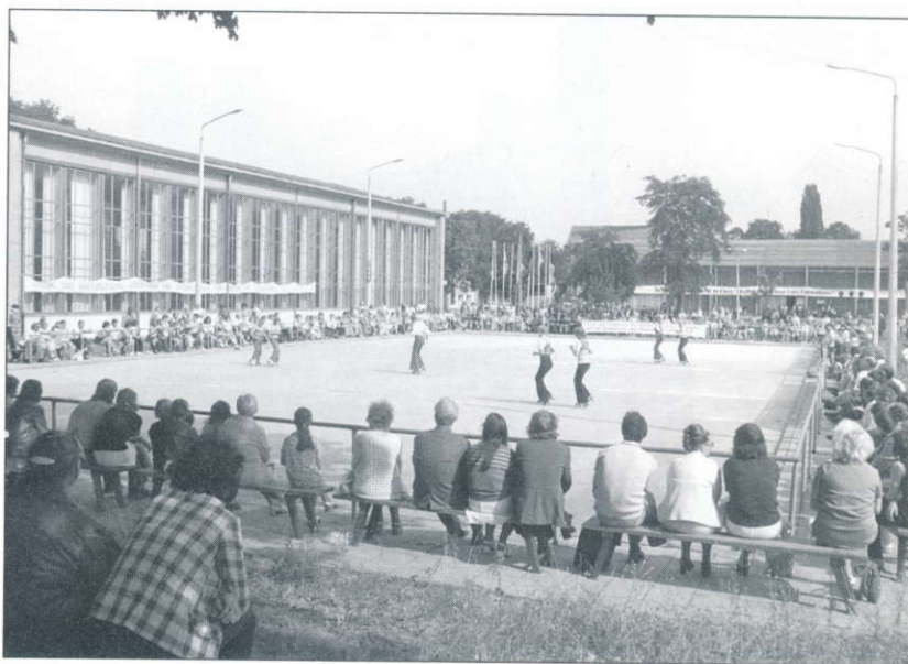
Einweihung der Rollsportanlage am 01.05.1972