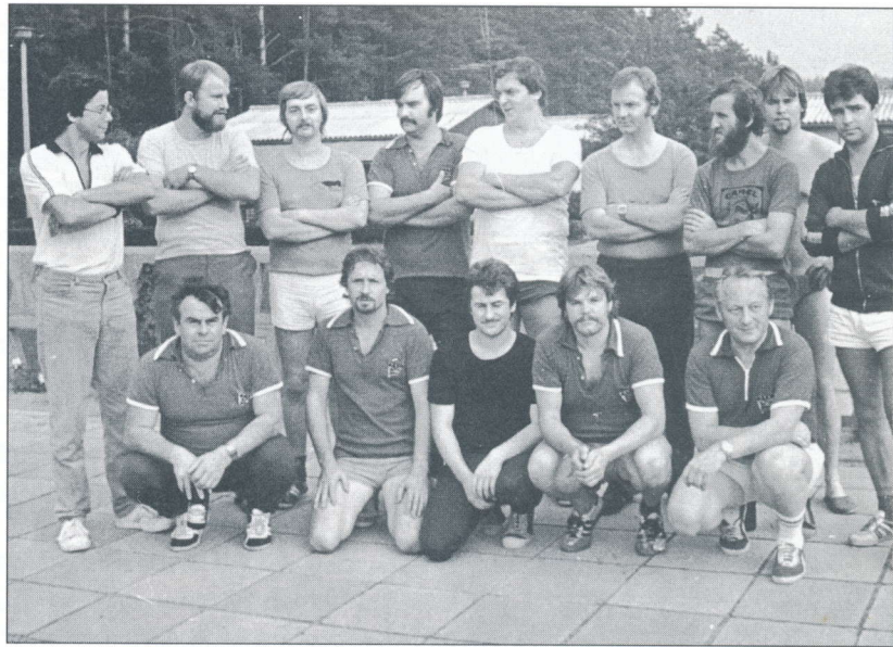
Trainingspause in Neu Bochow 1979

Letztere betraf die Schüler der Schule 16 in Babelsberg, in deren Halle damals wie heute Training und