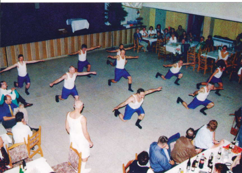
Auftritt der Leichtathleten zur Jahreshauptversammlung 1988

zeitlich völlig verschlissenen Raumzellentrakt als Funktionsgebäude im neuen Jahrtausend? Kurze Rede, weil eindeutiges Ergebnis im Jubiläumsjahr: Unser Verein verfügt per Erbbaurecht über ein 30.000 m 2 großes Areal, dessen funktionale Nutzung mit Sport festgeschrieben ist. Die Bootsstege sind sinnvoll rekonstruiert, das Gelände vernünftig eingezäunt. Wir beschäftigen mit Rüdiger Rauchfuß und Hans-Joachim Borchert zwei fleißige Platzwarte. Der Fußballrasenplatz, die Leichtathletikanlagen besitzen den erforderlichen Pflegezustand,