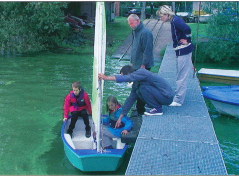
Jugendgruppe bei der Vorbereitung zum Segeln

Im Vorfeld für den Bau der Humboldtbrücke Mitte der 70er Jahre musste der Bootsplatz „Ehm & Happke“ zum Sportplatz in die Berliner Straße verlegt werden. Mit der Übernahme der Bootshalle und der einfachen Bootsstege 1978 vom VEB Naherholung Potsdam zum RAW erfolgte die Gründung der Sektion Wassersport. In der Bootshalle gibt es 30 Winterplätze für Ruderboote und Kanadier.