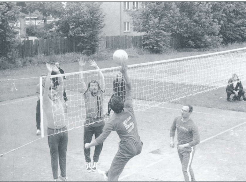
Freundschaftsspiel auf dem Sportplatz in der Berliner Straße 1982

Die jährlichen Betriebsmeisterschaften boten eigentlich immer wieder den Ansatz und Gelegenheit, regelmäßiges Training und organisierten Spielbetrieb unter dem Dach des Vereins zu betreiben. Gleichwohl dauerte es geraume Zeit, ehe sich nach der erstmaligen Gründung im Jahre 1972 erst in den 80er Jahren eine gewisse Kontinuität und Steigtigkeit einstellte.