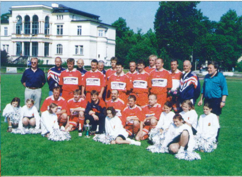
Stadtmeister am 21. Mai 2000