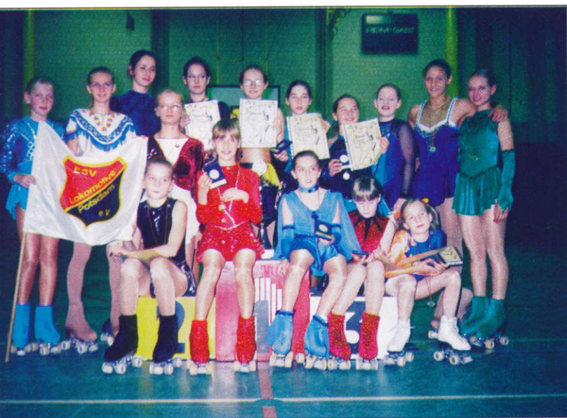
Pokalsieg 1998 in Münster