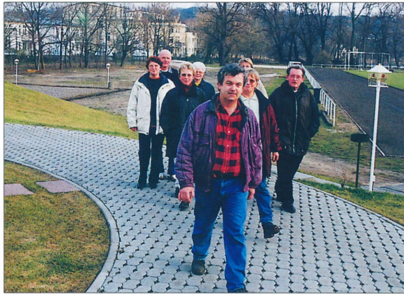
Beginn einer Wanderung vom Sportgelände des Vereins

Fast alle Mitglieder der Abteilung besitzen langjährige Erfahrungen im Wandern bzw. Trekking. Alle Wanderungen werden unter Leitung von ausgebildeten und in der Praxis erfahrenen Fachübligungsleitern mit DSB-Lizenz durchgeführt. Die konkrete Veranstaltungsplanung wird jährlich in einem Veranstaltungskalender herausgegeben. Auszüge daraus erscheinen in regionalen Zeitungen, bundesweit sogar in der wanderspezifischen bzw. touristischen Presse. Die Teilnahme an den Wanderungen steht jedem Interessierten unter Beachtung des jeweiligen Schwierigkeitsgrades frei. Die Abteilung und auch ihre Einzelmitglieder haben alle nur