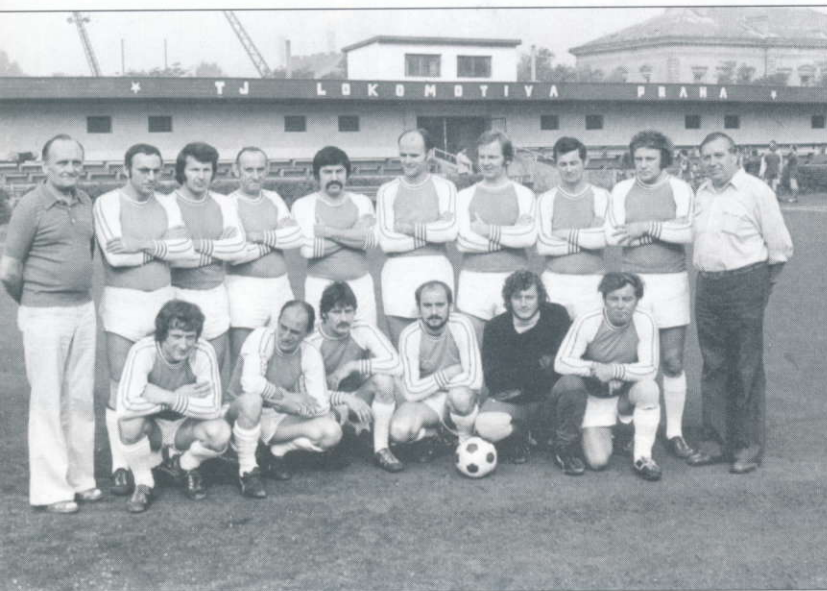
Die Fußballer von Lok Potsdam bei den Partnern in Prag 1978