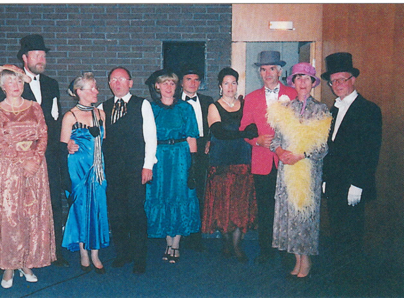
Tanzsportler vor dem Auftritt

Die Abteilung ist 1992 beim ESV Lokomotive Potsdam gegründet worden. Es war keine typische Neugründung, sondern eine Fortsetzung der seit Mitte der 80er Jahre bestehenden Gruppe von Ehepaaren, die sich dem Tanzen als Hobby und sportlicher Bestätigung verschrieben hat.