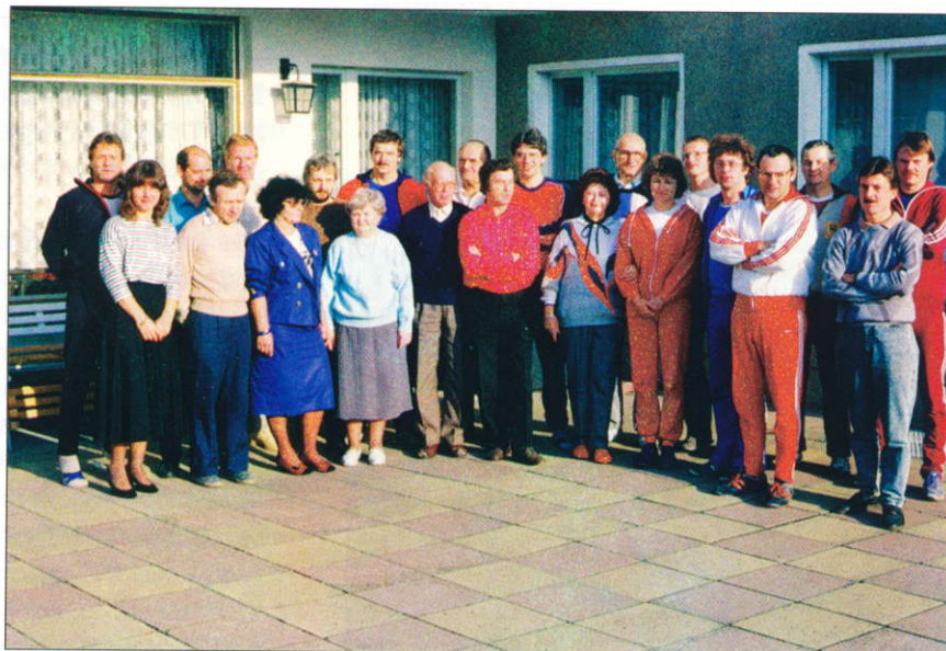
Der erweiterte Vorstand von Lok Potsdam in Neu Bochow 1986

Diese „Auswahl“ verdienstvoller Funktionäre musste ich nicht treffen, sie drängt sich einfach auf. Sind es doch genau die Sportfreunde, mit denen ich in meinen 25 Jahren Vereinszugehörigkeit am intensivsten zusammengearbeitet habe. Sie haben einen ganz entscheidenden Anteil an der erfolgreichen Entwicklung im Verein, der Kontinuität der Arbeit,