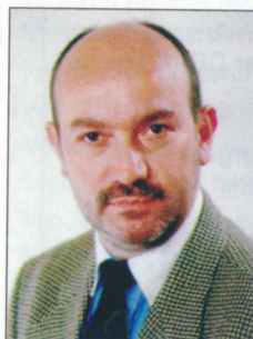
Hans-Joachim Endrikat Versicherung