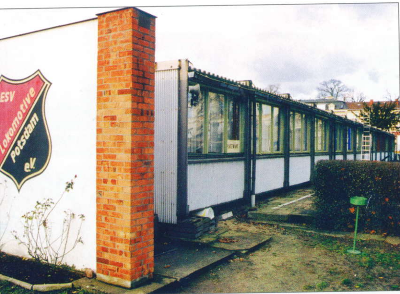
Raumzellentrakt mit Umkleideräumen