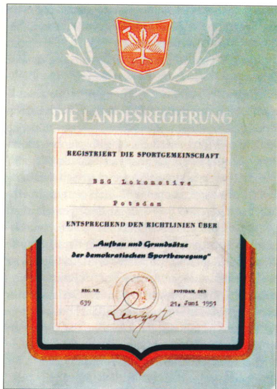
Gründungsurkunde der BSG Lokomotive Potsdam

Am 18. Januar 1951 wurden durch die Regierung 1951 Vorschläge zum Ausbau von Sportanlagen und der Durchführung von Sportwettkämpfen unterbreitet. Etwa 20 bis 30 Sportler begannen, auf dem Boden eines Gebäudes der heutigen Landesregierung Tischtennis zu spielen. Sie bildeten die erste Sektion der am 21. Juni 1951 durch die Landesregierung bestätigten BSG Lokomotive Potsdam.